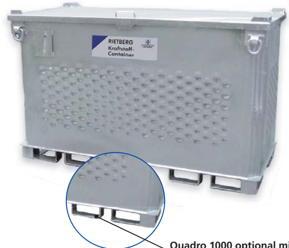
Quadro 1000 optional mit zusätzlichen Gabelschuhen