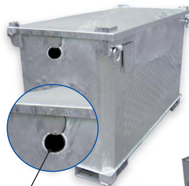
3" Durchführung für Vor- und Rücklaufleitung